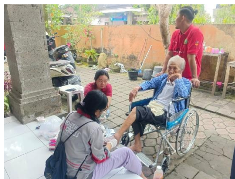
Gambar 4. Perawatan Luka Alergi pada Lansia