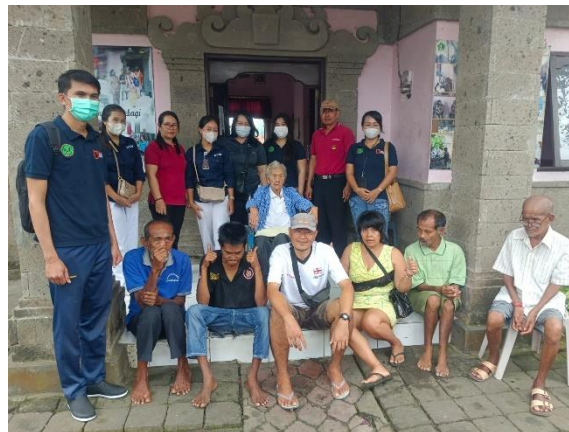
Gambar 6. Foto bersama Lansia dan ODGJ