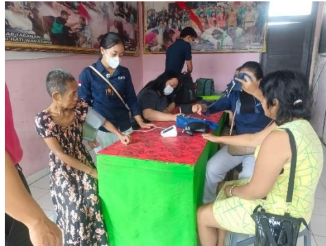
Gambar 2. Pemeriksaan Kesehatan pada ODGJ

suatu keadaan dimana tekanan sistol dan diastol mengalami kenaikan yang melebihi batas normal tekanan (tekanan sistol diatas 140 mmHg dan diastol diatas 90 mmHg) (Muwarni, 2011). Aktifitas fisik dapat berpengaruh terhadap tekanan darah lansia. Aktifitas fisik merupakan setiap gerakan tubuh yang dihasilkan oleh otot rangka yang memerlukan pengeluaran energi. Kurangnya aktifitas fisik merupakan faktor risiko indepeden untuk penyakit kronis (Iswahyuni, 2017).