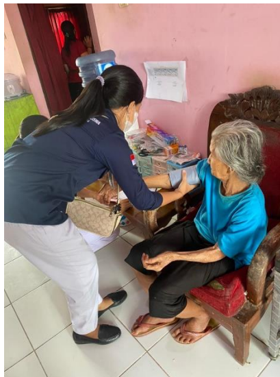
Gambar 3. Pemeriksaan Kesehatan pada Lansia