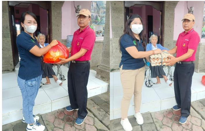
Gambar 5. Pemberian bahan makanan bernutrisi

Pada tahap ini dilaksanakan pemberian bahan makanan bernutrisi untuk memenuhi kebutuhan gizi Lansia dan ODGJ di UPTD Pelayanan Sosial dan Perlindungan Perempuan dan Anak Wanasara Tabanan. Memenuhi kebutuhan gizi lansia sangat perlu dilakukan mengingat pada lansia akan terjadi penurunan aktifitas fisiologis tubuh. Konsumsi pangan yang kurang seimbang akan memperburuk kondisi lansia yang secara alami memang sudah menurun. Dibandingkan dengan usia dewasa, kebutuhan gizi lansia umumnya lebih rendah karena adanya penurunan metabolisme basal dan kemunduran fungsi tubuh yang lain. Gizi kurang sering disebabkan oleh masalah sosial ekonomi dan juga karena gangguan penyakit, bila konsumsi kalori yang terlalu rendah dari yang dibutuhkan maka berat badan kurang dari normal. Apabila hal ini disertai dengan kekurangan protein maka akan terjadi kerusakan-kerusakan sel yang tidak dapat diperbaiki sehingga menyebabkan rambut rontok, dan daya tahan menurun (Akbar et al., 2020).