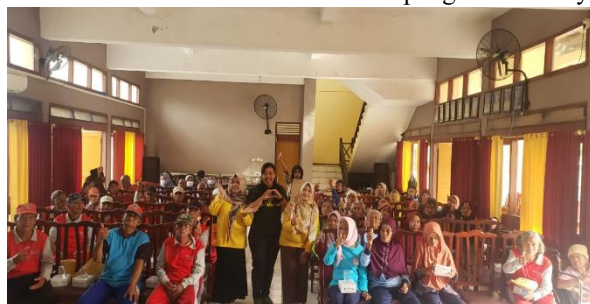
Gambar 2. Pelaksanaan kegiatan pretest dan posttest terkait Gout Arthritis