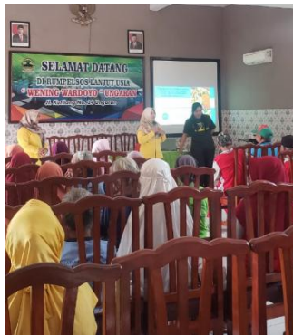
Gambar 1. Edukasi materi Gout Arthritis oleh tim pengabdian masyarakat.

Dalam upaya meningkatkan pengetahuan dan kesehatan lansia, tim pengabdian dari Universitas Ngudi Waluyo melaksanakan program edukasi dan pelatihan senam ergonomis di Panti Wening Wardoyo, Ungaran. Kegiatan ini bertujuan untuk memberikan pemahaman tentang pengelolaan Gout Arthritis , termasuk informasi obat, serta memberikan alternatif terapi non-farmakologi melalui senam ergonomis. Kegiatan utama, yaitu edukasi Gout Arthritis dan pelatihan senam ergonomis. Edukasi disampaikan melalui penyuluhan yang mencakup informasi penyakit gout , pengelolaan obat, dan efek samping. Media yang digunakan meliputi slide presentasi, leaflet, dan sesi tanya jawab.