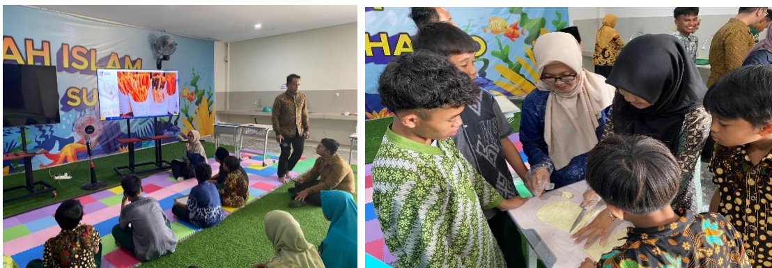
a. b. Gambar 3. Pemberian Materi Kemasan dan Pelabelan (a) Praktek (b)

Peningkatan pemahaman peserta terhadap aspek pelabelan juga menjadi capaian penting. Peserta dilatih untuk mencantumkan informasi utama pada label produk seperti nama produk, komposisi, produsen serta informasi tambahan seperti tanggal produksi, berat bersih, dan no telepon produsen. . Praktik ini sejalan dengan program pengabdian oleh Khoiriyah et al. (2025) yang menyebutkan bahwa label dan legalitas merupakan faktor kunci dalam membangun kepercayaan konsumen terhadap produk UMKM berbasis singkong.