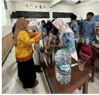
Gambar 2. Penjelasan masing-masing bahan dalam pembuatan sediaan