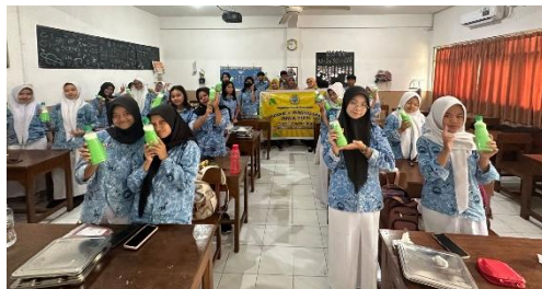
Gambar 4. Foto bersama responden