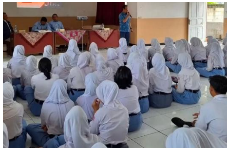
Gambar 2. Pemaparan materi