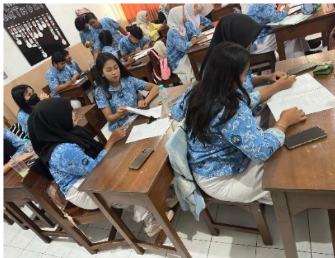
Gambar 1. Pretest/posttest