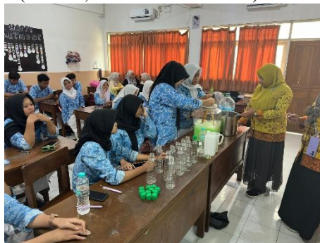
Gambar 3. Pelatihan pembuatan sediaan