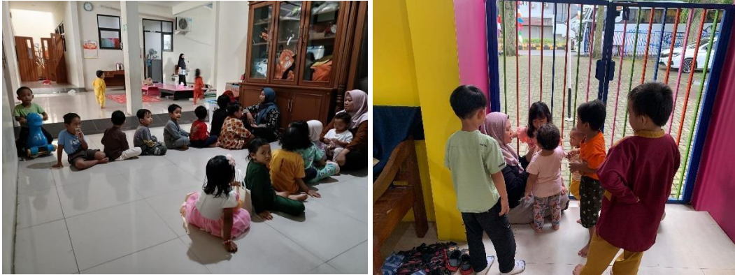
Gambar 1. Anak dapat mengantri untuk melatih kesabaran

perkembangan anak oleh pengasuh sangat membantu dalam mengevaluasi program stimulasi dan sebagai bahan refleksi bagi pengasuh maupun orang tua. Dengan adanya dokumentasi yang konsisten, TPA dapat meningkatkan kualitas layanan dan respons terhadap kebutuhan unik masing-masing anak.