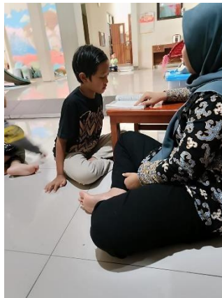
Gambar 2. Anak belajar membaca/mengaji

Hasil penelitian ini menunjukkan bahwa pengasuh di TPA Kecamatan Gunungpati telah memiliki tingkat pemahaman yang cukup baik dalam menstimulasi perkembangan kognitif anak, namun masih perlu penguatan pada aspek sosial emosional. Ketimpangan ini perlu mendapat perhatian lebih lanjut agar stimulasi yang diberikan tidak hanya fokus pada aspek intelektual, tetapi juga pada keseimbangan emosional anak. (Arisanti et al., 2024) menegaskan pentingnya pendekatan holistik dalam pengasuhan anak usia dini yang mencakup stimulasi emosional dan sosial, bukan hanya aspek akademik atau intelektual. Oleh karena itu, disarankan agar TPA dan pengelola program anak usia dini memperkuat kurikulum pelatihan pengasuh dengan materi khusus mengenai perkembangan sosial emosional. Selain itu, supervisi berkala, forum reflektif antar pengasuh, dan kolaborasi dengan psikolog anak dapat memperkuat pemahaman pengasuh secara menyeluruh. Upaya ini tidak hanya akan meningkatkan kompetensi pengasuh tetapi juga menjamin kualitas tumbuh kembang anak usia dini secara optimal.