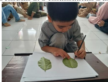
Gambar 1. Anak Mencetak/Mengikuti Pola Daun pada Kertas