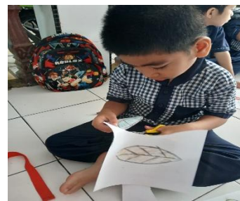
Gambar 3. Anak Menggunting Gambar Daun yang telah di Warnai pada Kertas

Berdasarkan hasil wawancara dengan Ibu M, pembelajaran berbasis bahan alam dilakukan melalui pemanfaatan dedaunan yang terletak di lingkungan sekitar sekolah memberikan ciri khas pembelajaran yang berfokus pada karakteristik pembelajaran kontekstual dan berbasis pengalaman langsung. Hal ini sesuai dengan pernyataan Ibu M bahwa “Melalui proses pembelajaran berbasis bahan alam ini mengacu pada pemanfaatan dedaunan yang diperoleh dari lingkungan sekitar sekolah, di mana anak-anak mengeksplorasi dan mengamati langsung beragam dedaunan”. Kegiatan eksplorasi seperti mengamati dan memetik dedaunan menunjukkan keterlibatan aktif anak dalam proses pembelajaran yang memanfaatkan lingkungan sebagai sumber utama pembelajaran berbasis bahan alam dedaunan. Pendekatan tersebut memberikan pengalaman konkret yang bermakna bagi anak usia dini, sehingga dapat mendorong penguatan konstruksi pengetahuan melalui interaksi langsung dengan lingkungan (Rahabav & Aihena, 2025).