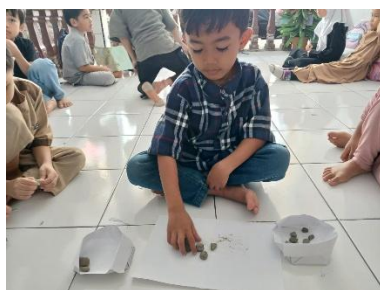
Gambar 2. Anak Menghitung Batu Besar dan Batu Kecil