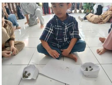
Gambar 1. Anak Mengelompokkan Batu Besar dan Batu Kecil