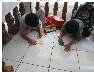
Gambar 2. Anak Menggambar & Mewarnai Pola Daun pada Kertas