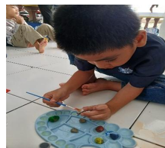
Gambar 3. Anak Mewarnai Batu Besar dan Batu Kecil

Berdasarkan hasil wawancara dengan Ibu S, pemanfaatan bahan alam berupa bebatuan digunakan untuk menerapkan kegiatan pembelajaran berbasis pengalaman langsung yang melibatkan partisipasi aktif anak. Hal ini sesuai ungkapan Ibu S bahwa “Anak diberi kesempatan untuk memungut batu di sekitar sekolah, kemudian mengelompokkan antara batu besar dan batu kecil”. Kegiatan tersebut mengindikasikan bahwa anak terlibat dalam proses eksplorasi dan mendorong penguatan pemahaman melalui interaksi dengan objek yang bersifat konkret. Aktivitas pengelompokkan berdasarkan ukuran besar dan kecil mencerminkan kemampuan klasifikasi anak yang diperoleh dari pengalaman nyata di lingkungan belajarnya. Oleh karena itu, pemanfaatan lingkungan sebagai sumber belajar dapat meningkatkan keterlibatan anak dan menghadirkan pengalaman belajar yang kontekstual (Farina, 2025).