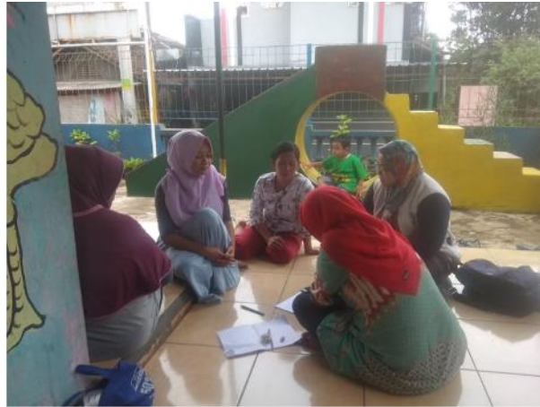
Gambar 1 XYXYXY font Size 10