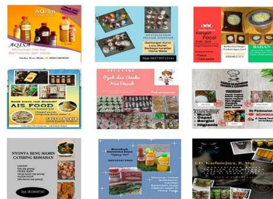
Gambar 1. Poster produk-produk UMKM Makanan Dan Minuman Manggarsari