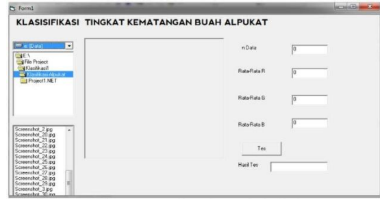
Gambar 3. Tampilan Sistem Dari Uji Citra

Pengujian pada sistem dilakukan dengan melakukan input data berupa 14 sample alpukat ke sistem yang telah dirancang. Sample buah alpukat berupa gambar berekstensi .jpg dan .png yang terdiri dari 4 sampel alpukat setengah matang. 5 sampel alpukat matang dan 5 sampel alpukat mentah. Adapun gambar sistem serta hasil pengujian dari sistem ialah sebagai berikut.