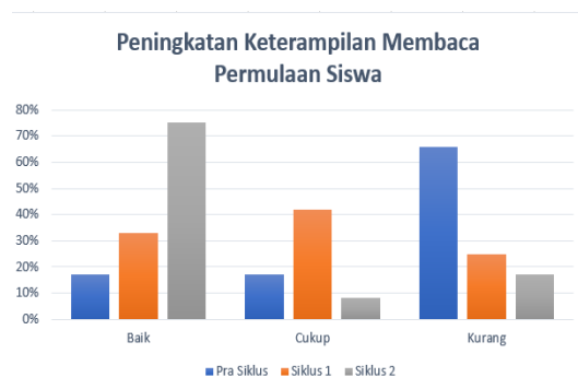
Gambar 2. Grafik peningkatan keterampilan membaca siswa.

Peningkatan keterampilan membaca siswa dapat dilihat pada grafik berikut: