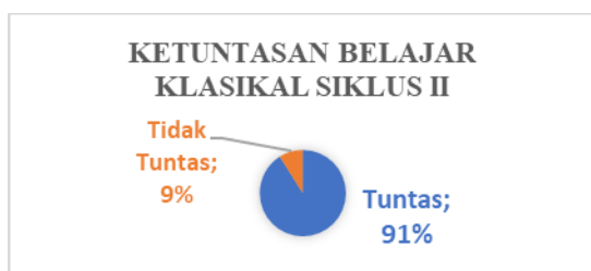
Gambar 3. Diagram Persentase Keterampilan Membaca Kata Siklus II

Tidak terdapat siswa dalam kategori perlu bimbingan dengan persentase 0%. 1 siswa dalam kategori kurang dengan persentase 9,10%, 3 siswa dengan kategori baik dengan persentase 27,27%, dan 7 siswa dalam kategori sangat baik dengan memperoleh persentase 63,63%.