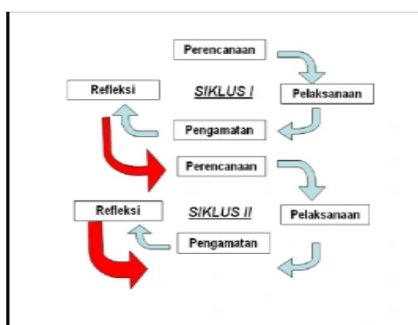
Gambar 1. Alur Penelitian PTK Kemmis dan MC Taggart

Penelitian tindakan kelas ini menggunakan model Kemmis dan MC Taggart (1988). Model PTK ini menggunakan model spiral dengan menggunakan beberapa siklus tindakan. Tahapan penelitian tindakan kelas terdiri dari perencanaan, tindakan, pengamatan, dan refleksi. Penelitian ini dilakukan pada kelas 1 di SDN 3 Keling yang berlokasi di Desa Keling, Kecamatan Keling, Kabupaten Jepara. Penelitian ini dilakukan dengan dua siklus, setiap siklus terdiri dari dua pertemuan. Subjek dalam penelitian ini dilakukan pada siswa kelas 1 SDN 3 Keling yang berjumlah 11 siswa. Kelas I tersebut terdiri dari 4 siswa laki-laki dan 7 siswa perempuan. Objek penelitian ini adalah peningkatan keterampilan membaca kata siswa kelas 1 pada materi membaca nama-nama buah, makanan, hewan, dan benda mata pelajaran Bahasa Indonesia dengan menggunakan model pembelajaran STAD ( Student Teams Achievement Divisions ) berbantuan dengan media power point .