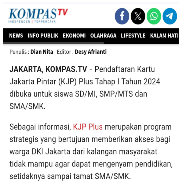
Gambar 2. Bukti Teks Berita

Pendaftaran Kartu Jakarta Pintar (KJP) Plus Tahap I Tahun 2024 dibuka untuk siswa SD/MI, SMP/MTS dan SMA/SMK. (24 April 2024)