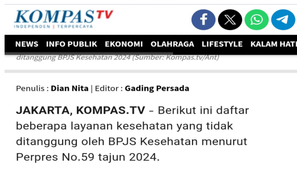
Gambar 3. Bukti Teks Berita

Berikut ini daftar beberapa layanan Kesehatan yang tidak ditanggung oleh BPJS Kesehatan menurut Perpres No.59 tahun 2024.