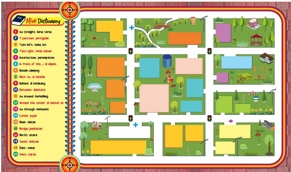
Gambar 1. Metaplan bergambar berbentuk karpet bergambar dengan tema peta kota