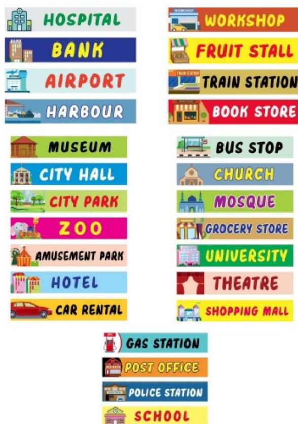
Gambar 3. Gambar bangunan dan nama-nama tempat dalam bahasa Inggris

setiap kelompok terdiri dari 1 anak yang akan menjadi penunjuk arah dan 1 anak lagi akan menjadi seseorang yang berpura-pura menanyakan dimanakah keberadaan suatu tempat. Tugas anak pertama sebagai penunjuk arah adalah memberikan petunjuk dengan petunjuk-petunjuk yang sederhana dan mudah dipahami oleh anak-anak usia dini yaitu usia 4-6 tahun. Perintah yang diberikan kepada anak kedua berupa upaya menunjukkan arah dan jalan adalah dengan memberikan instruksi seperti: “go ahead!”, “turn left”, “turn right”, “stop” dan “finish”. Tugas bagi anak kedua adalah menanyakan letak lokasi sebuah tempat sesuai dengan pola pertanyaan yang sudah ada (figure 2) kepada anak pertama. Setelah semua pertanyaan selesai, maka kegiatan ini dapat dilakukan secara bergantian, posisi anak pertama dengan tugas sebagai penunjuk arah berganti menjadi anak kedua sebagai seseorang yang menanyakan letak lokasi suatu tempat, begitu juga sebaliknya. Durasi pelaksanaan dilakukan sesuai kebutuhan pembelajaran masing-masing dan setelah kedua anak di tim pertama sudah sele-