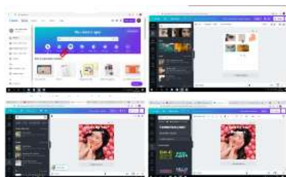
Gambar 2. Tutorial membuat konten produk dengan aplikasi Canva secara luring.

Pengabdian kepada masyarakat kali ini kami melakukan pembinaan dengan memberikan tutorial pembuatan konten produk yang dapat meningkatkan daya tarik dan minat beli, serta mampu menjangkau target konsumen yang potensial. Tutorial pembuatan konten produk dengan menggunakan aplikasi Canva . Aplikasi ini tidak berbayar dan mudah digunakan oleh pengguna serta menghasilkan hasil grafis yang sangat baik. Selama ini promosi dari produk ataupun jasa yang ada di BUMDesMart masih menggunakan traditional marketing .