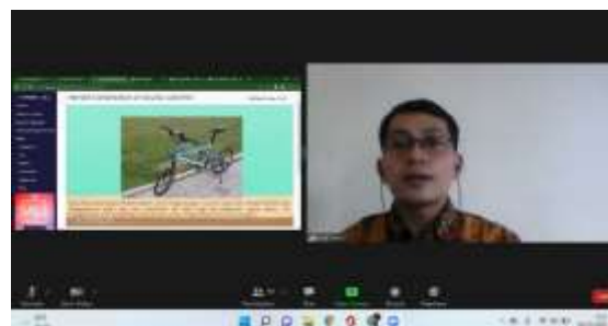
Gambar 1. Pelatihan konten produk untuk meningkatkan daya tarik dan minat beli secara daring

mengkoordinasikan sistem produksi untuk menghasilkan produk. Didefinisikan secara luas, fungsi manufaktur juga sering mencakup pembelian, distribusi, dan instalasi. Kumpulan kegiatan ini kadang-kadang disebut rantai pasokan ( supply chain ) (Maulana et al., 2021).