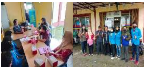
Gambar 4. Diskusi dan Evaluasi Akhir Pengabdian bersama Direktur BUMDes

Di akhir kegiatan monitoring dan evaluasi, tim pengabdian kepada masyarakat merasa bahagia karena umpan balik yang ditunjukkan oleh peserta yaitu manajemen dan karyawan BUMDes, serta mitra usaha lainnya yang tergabung dalam BUMDes dapat menerima dengan baik materi serta pelatihan yang diberikan, yang ditunjukkan dari antusias peserta yang melakukan praktik langsung, peningkatan pengetahuan pelaku usaha serta hasil dari kuesioner yang dibagikan oleh tim pengabdian. Secara keseluruhan, pelaksanaan program pengabdian kepada masyarakat ini telah terlaksana dengan baik.