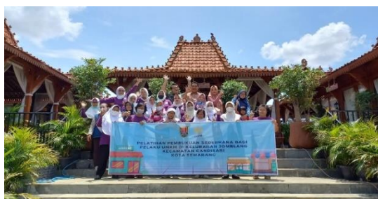
Gambar 4 Foto bersama.