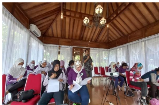
Gambar 3 Kegiatan Proses Sosialisasi.