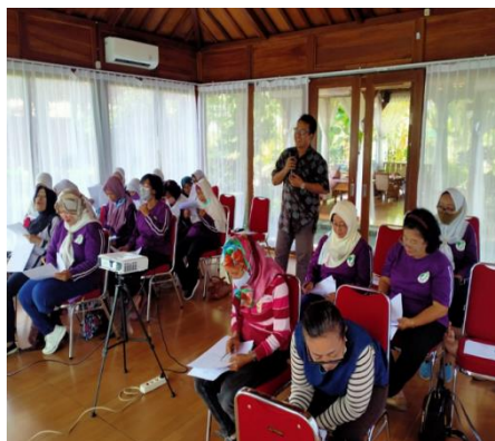
Gambar 2 Kegiatan Pelaksanaan Pengabdian

Pada saat sosialisasi, dipaparkan beberapa keunggulan dan manfaat dari pembukuan sederhana. Tujuannya untuk membangun kesadaran pelaku UMKM akan pentingnya melakukan pembukuan sederhana secara konsisten. Hal ini harus dilakukan agar laporan keuangan yang diterbitkan oleh pelaku UMKM dapat dipahami oleh para penggunanya.