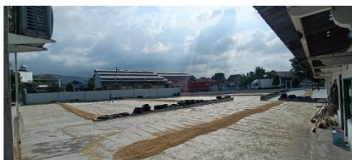
Gambar 2. Kondisi lapangan.