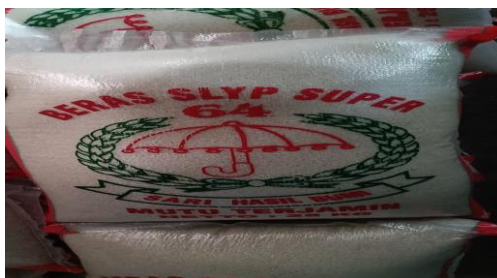
Gambar 3. Logo branding produk