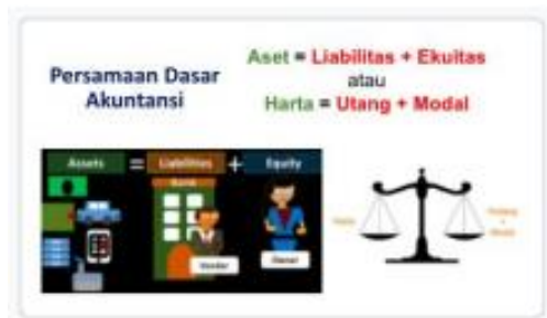
Gambar 4. Materi presentasi

Hasil kegiatan ini sejalan dengan penelitian Yunita et al. (2024) yang menunjukkan bahwa pelatihan literasi keuangan dapat meningkatkan kemampuan pelaku UMKM dalam membuat laporan keuangan sederhana. Peningkatan pemahaman literasi keuangan memberikan dampak positif berupa Transparansi keuangan: Pelaku usaha dapat melihat dengan jelas kondisi keuangan usaha mereka, Pengambilan keputusan yang lebih baik: Keputusan investasi, penetapan harga, dan ekspansi usaha dapat dilakukan