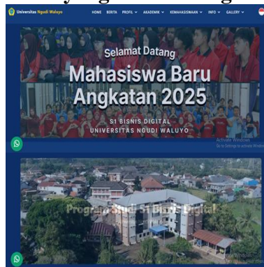
Gambar Tampilan Awal Website

Pengembangan konten persuasif yang mendukung identitas Program Studi S1 Bisnis Digital ditunjukkan melalui perancangan tampilan halaman utama website yang menampilkan visual dan pesan komunikasi yang kuat. Gambar tersebut memperlihatkan penggunaan banner dengan kalimat “Selamat Datang Mahasiswa Baru Angkatan 2025” yang dikombinasikan dengan visual aktivitas mahasiswa dan lingkungan kampus. Penyusunan narasi singkat dan jelas pada bagian ini bertujuan untuk membangun kesan pertama yang positif serta memperkuat citra Program Studi S1 Bisnis Digital sebagai lingkungan akademik yang aktif dan adaptif terhadap perkembangan era digital.