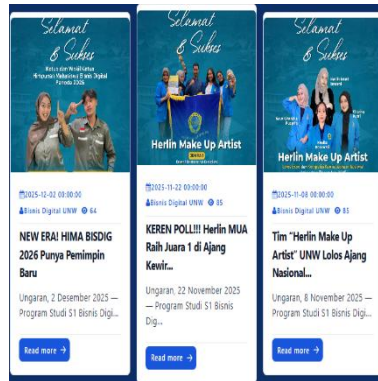
Gambar Artikel Website Prodi

Implementasi ilmu perkuliahan dalam konteks praktik nyata terlaksana melalui penyusunan dan publikasi artikel berita mahasiswa pada website Program Studi S1 Bisnis Digital. Gambar tersebut menampilkan beberapa artikel kegiatan dan prestasi mahasiswa yang disusun dengan menerapkan teori copywriting yang diperoleh selama perkuliahan, khususnya pada mata kuliah Copywriting Marketing . Peneliti mengaplikasikan penelitian headline yang menarik, penyusunan narasi menggunakan metode ADIKSIMBA dan penggunaan call to action untuk meningkatkan interaksi audiens. Melalui praktik ini, peneliti memperoleh pengalaman langsung dalam menerapkan konsep teoritis ke dalam dunia nyata bagi peningkatan kualitas artikel dan citra Program Studi S1 Bisnis Digital Universitas Ngudi Waluyo.