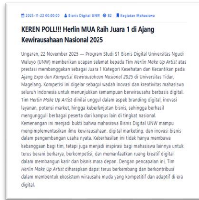
Gambar Artikel Kegiatan Mahasiswa

Optimalisasi website sebagai media informasi dan promosi strategis ditunjukkan melalui publikasi artikel kegiatan mahasiswa yang disusun dengan copywriting informatif dan persuasif. Gambar tersebut menampilkan salah satu artikel dengan judul “KEREN POLL!!! Herlin MUA Raih Juara 1 di Ajang Kewirausahaan Nasional 2025” yang memuat informasi kegiatan secara lengkap, mulai dari waktu dan tempat pelaksanaan hingga pencapaian prestasi yang diraih. Penyusunan artikel ini dilakukan dengan struktur ADIKSIMBA, headline yang menarik, dan pemilihan kata yang menonjolkan keunggulan mahasiswa Program Studi S1 Bisnis Digital. Melalui artikel website ini, website tidak hanya berfungsi sebagai sarana menyampaikan informasi kegiatan, tetapi juga sebagai media promosi yang mampu membangun citra program studi melalui pencapaian mahasiswa di tingkat nasional.