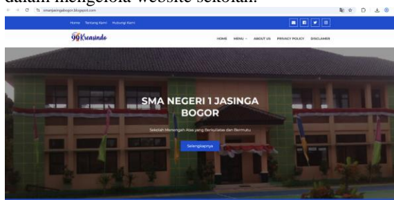
Gambar 5. Contoh Tampilan Website Sekolah

Peningkatan kompetensi guru juga terlihat dari keaktifan peserta dalam sesi diskusi dan pendampingan daring. Guru mulai menunjukkan kreativitas dalam menyajikan konten, memanfaatkan fitur yang tersedia, serta menyesuaikan tampilan website dengan identitas sekolah. Hal ini menunjukkan bahwa kegiatan pelatihan dan pendampingan tidak hanya meningkatkan keterampilan teknis, tetapi juga menumbuhkan kepercayaan diri dan kreativitas guru dalam mengelola website sekolah.