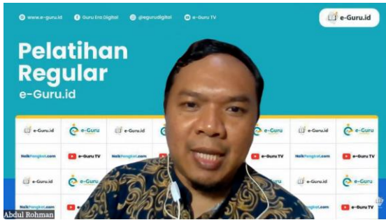
Gambar 2. Pemberian Materi