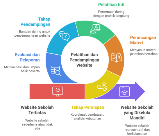
Gambar 1. Tahapan Pelaksanaan PKM

Pelaksanaan kegiatan dilakukan secara daring selama enam bulan pada tahun 2024, mencakup tahap persiapan, pelatihan inti, pendampingan, serta evaluasi dan pelaporan. Platform yang digunakan dalam pembuatan website sekolah adalah Blogger, karena bersifat gratis, mudah digunakan, dan sesuai bagi guru tanpa latar belakang teknis pemrograman.